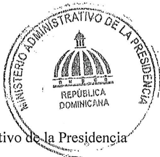
José Ignacio Paliza Ministro Administrativo de la Presidencia